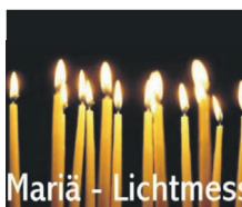
Mariä - Lichtmess

Am Mittwoch, dem 5. Februar, sind im Dorfladen «Jakob» gesegnete Brote erhältlich.